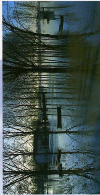
La Saône en crue à Pont-de-Vaux transfigure, aux saisons de pluie, le paysage de la vaste plaine.